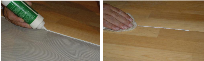
Application de scellant à joint Beauflor 262 et nettoyage avec un chiffon humide