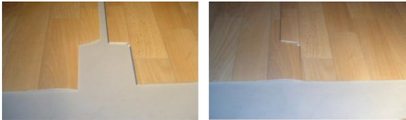
Découpe d'ouvertures au joint pour l'alignement des motifs